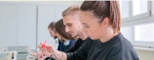
SISTEMES ELECTROTÈCNICS I AUTOMATITZATS