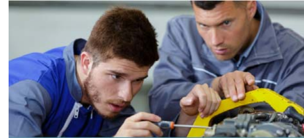
AUXILIAR DE MANTENIMENT I REPARACIÓ DE VEHICLES DE MOBILITAT PERSONAL