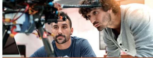
AUTOMATITZACIÓ I ROBÒTICA INDUSTRIAL