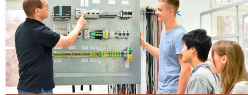
INSTAL·LACIONS ELÈCTRIQUES I AUTOMÀTIQUES