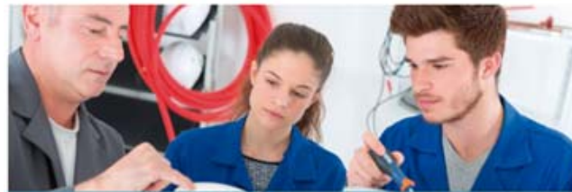
AUXILIAR DE MUNTATGES D'INSTAL·LACIONS ELÈCTRIQUES D'AIGUA I GAS