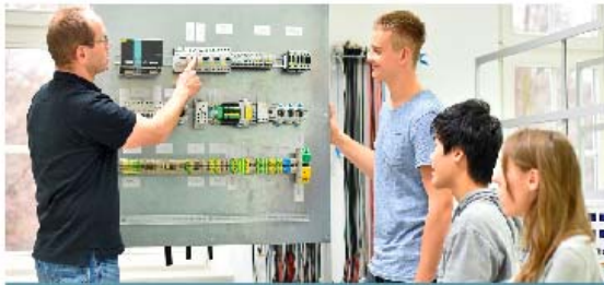
AUXILIAR DE MUNTATGES D'INSTAL·LACIONS ELECTROTÈCNiques D'EDIFICIS