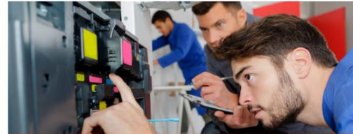
FORMACIÓ PROFESSIONAL BÀSICA ELECTRICITAT-ELECTRÒNICA